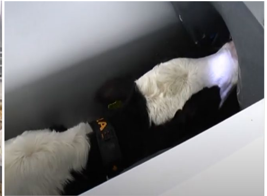
Утримання молодняка ВРХ до 2-х місяців в індивідуальних будиночках типу «Іглу» до 2-х місяців і випоюванні на станції «Комбі-2»