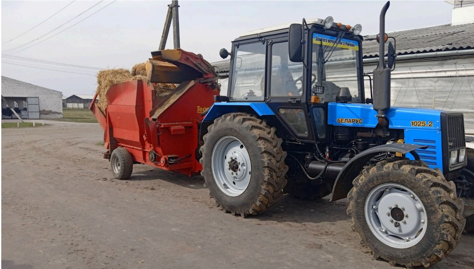
Проведення подрібнення та вивантаження грубих кормів та соломи подрібнювачем Tomahawk 8100 при безприв'язному утриманні