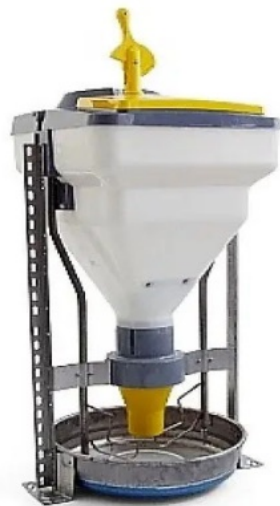
Кормоавтомат AP SWING для обслуговування свиней на відгодівлі