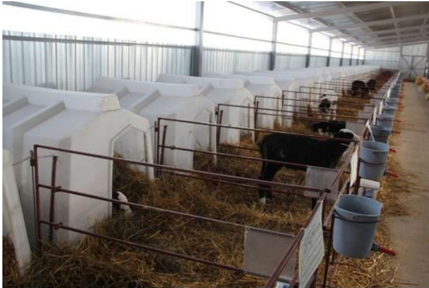
Індивідуальні будиночки типу «Іглу»