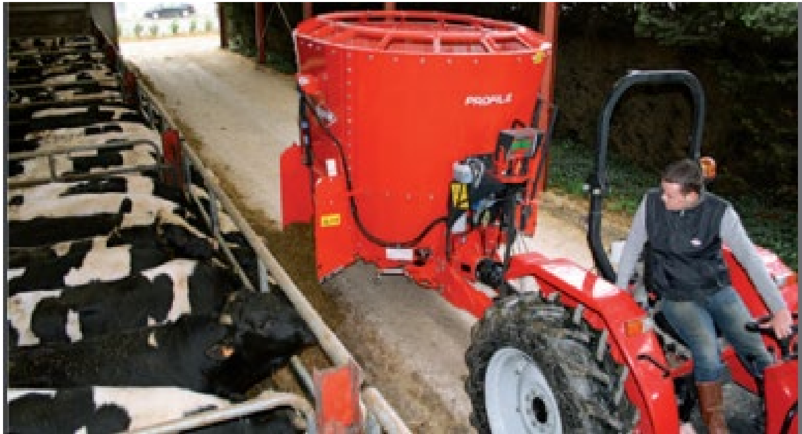
Роздавання кормів молодняку ВРХ при великогруповому утриманні кормороздавачем KUHN EUROMIX з одним вертикальним шнеком