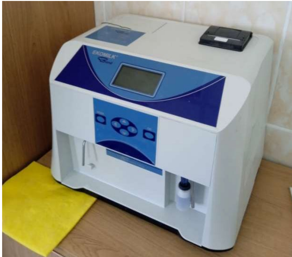
Проведення визначення якості молока аналізатором «Екомілк БОНД»