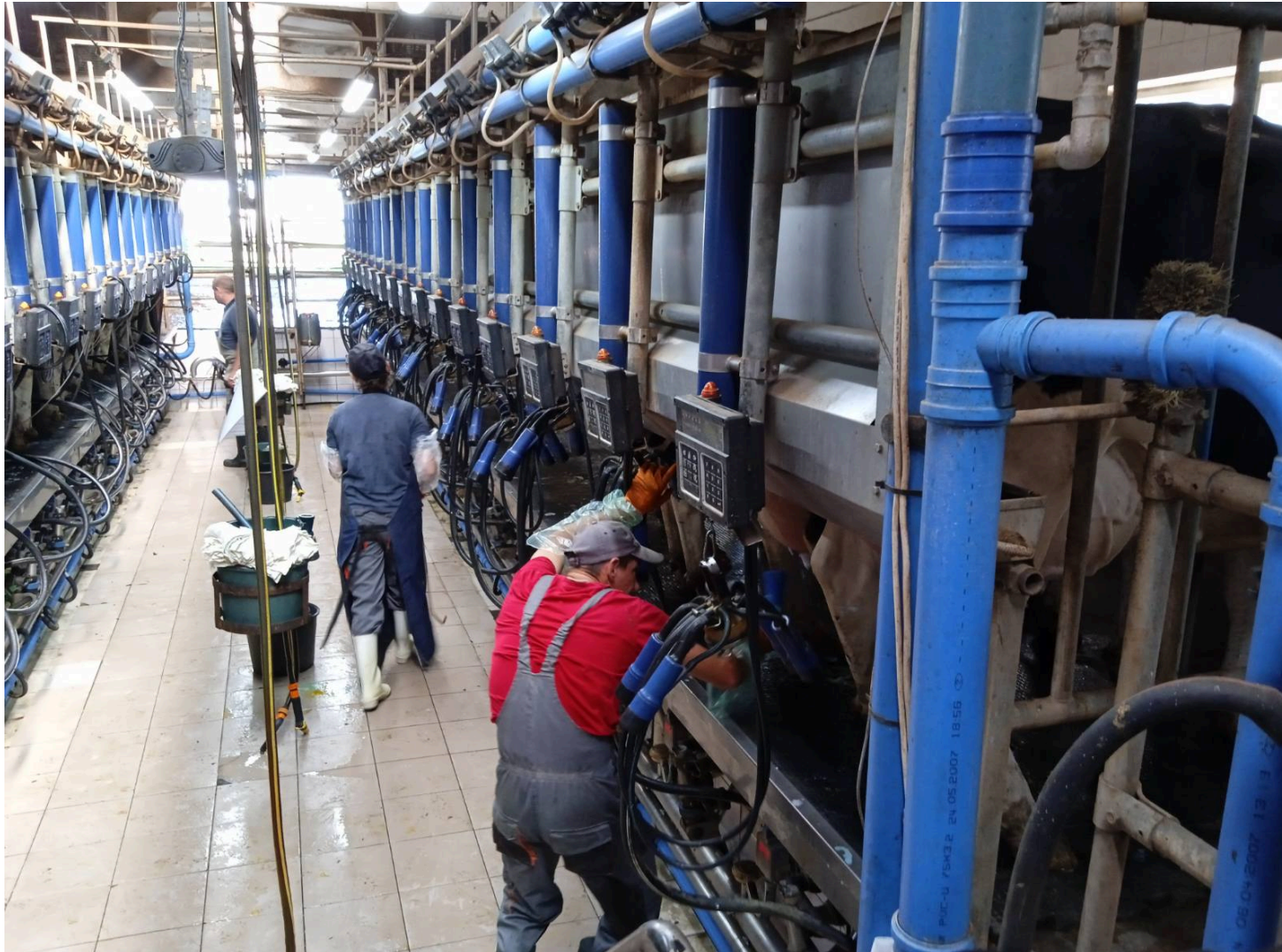
Робота оператора при доїнні корів установкою “Паралель” 2×16