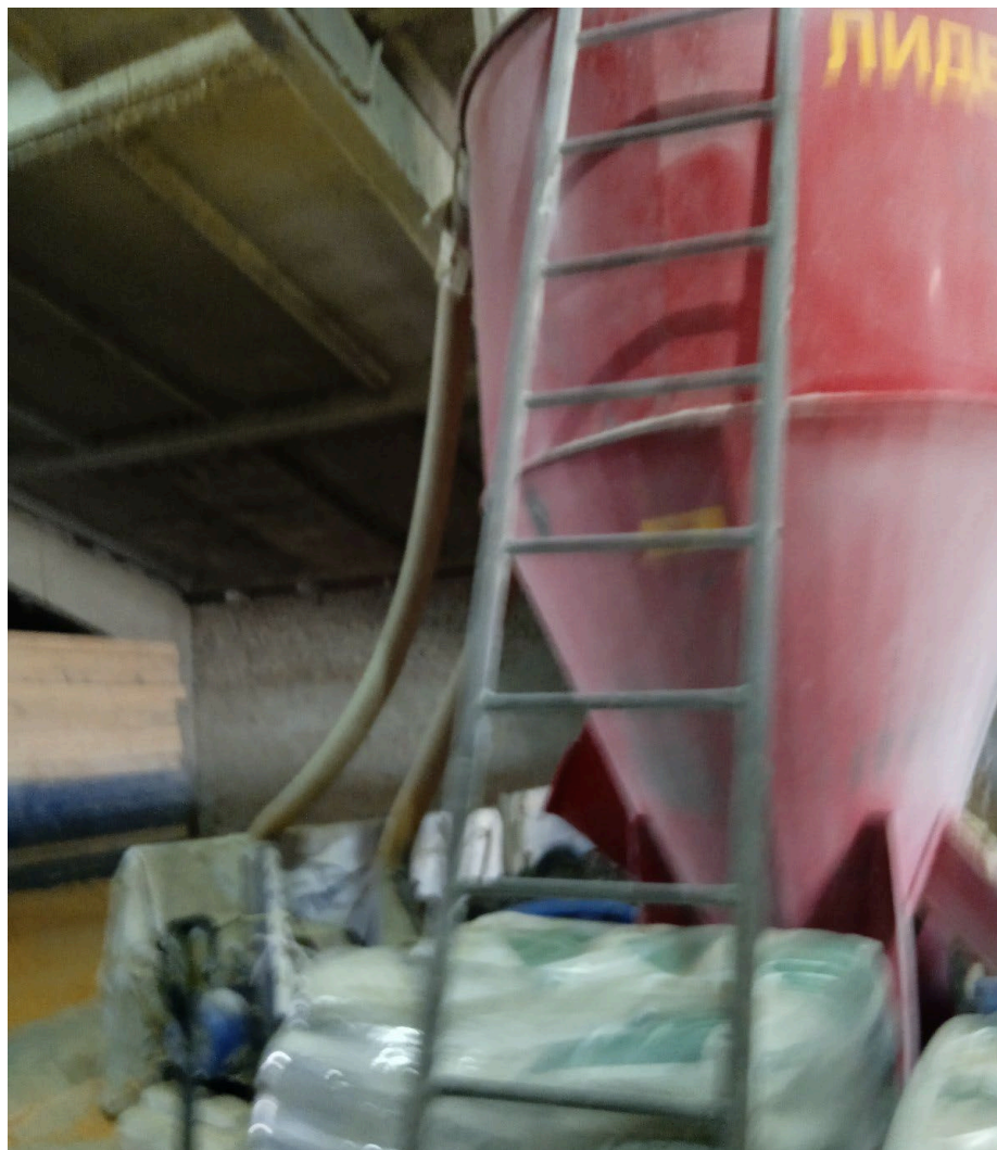
Комбікормова установка «Лідер»