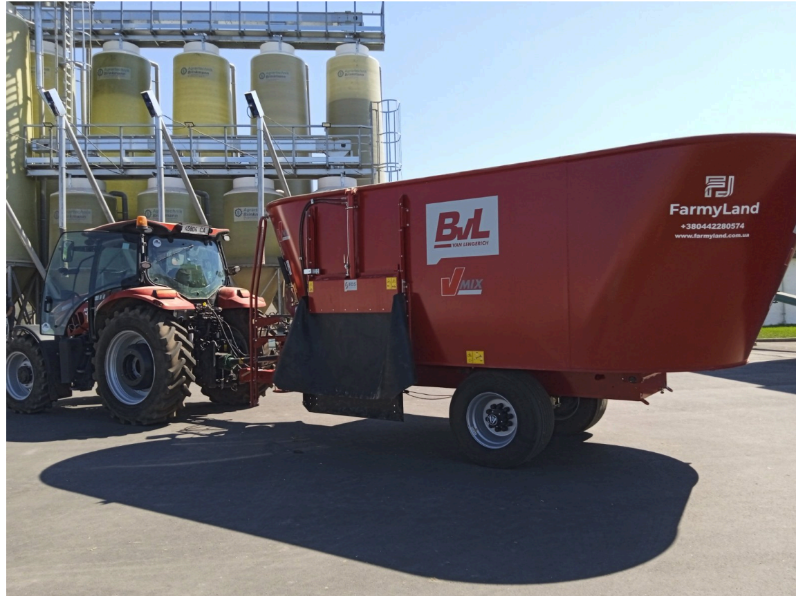
Гормозмішувач V-Mix-20 BvL

При проведенні спостережень встановлено, що тракторист працює згідно НОН умовного вивільнення не існує. Розроблено 1 норматив чисельності, 1 норму продуктивності також розраховано 20 поопераційних нормативів часу, 2 нормативи часу на відпочинок та особисті потреби та 5 нормативів на підготовчо-заключну роботу.