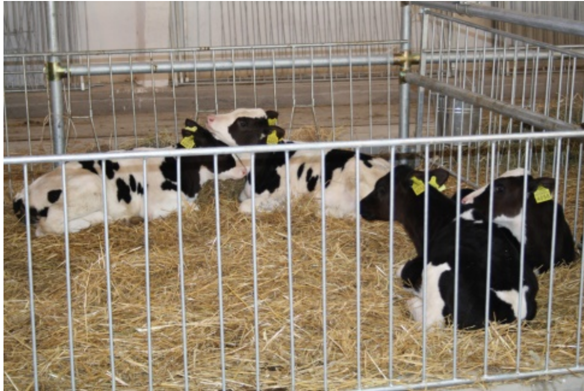
Безприв'язне утримання у боксах на глибокій підстилці