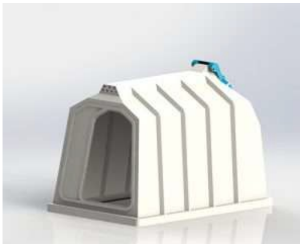
Індивідуальний будиночок KRAFT Premium