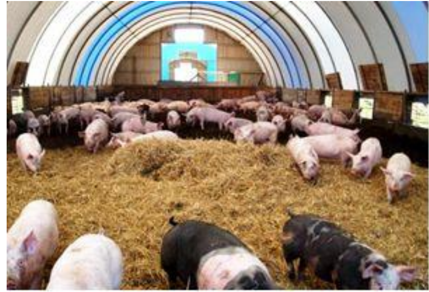
Холодне утримання свиней віком 2-4 міс. на глибокій підстилці в ангарах